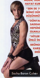
Sacha Baron Cohen

"USAME BİN LADİN ÇOK COOL VE ŞİK BİR ADAM."