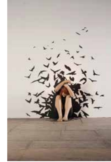
Fear Of Reason (2013)

Bu tasvirler üzerinden bahsettiğim konuları düşünmek, sormak... Dolayısıyla bir gün aklıma "yaşlılık evresi" etrafında şekillenebilecek sorular takılmaya başlarsa, heykeller de değişebilir.