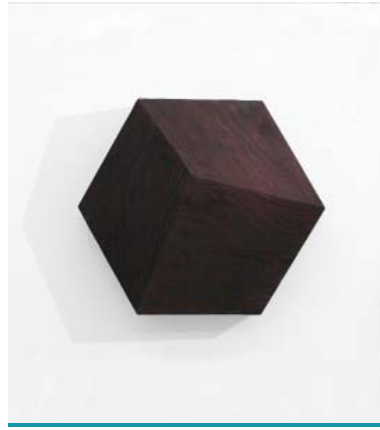
Ulrich Riedel “Dark Coco & Dark Igor” (detail), 2017 wood | variable dimensions

bu hibrid çalışmalar, kontürlerin görüntüyü silmeye başlayacak derecede iç içe geçtiği beyaz ve pastel renk tonlarında. Bu, sanatçının derinlik yaratma hedefiyle doğrudan çelişerek Meydan'ın pratiğinin merkezindeki gerilimi oluşturmaktadır.