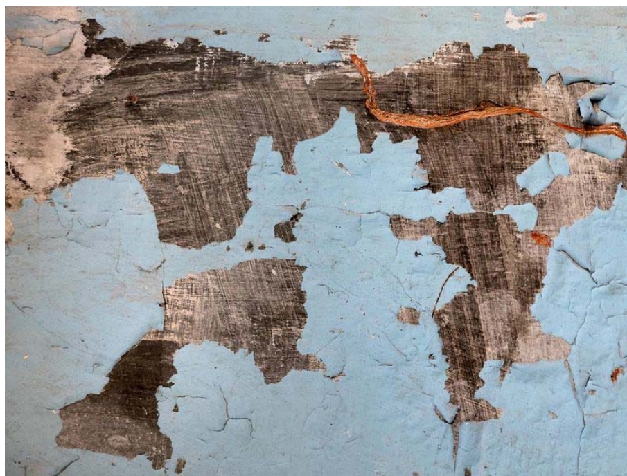
Sitki Kösemen | Untitled, from the series "Memory and Scenery", 2012, C-print, 140 x 105 cm

Die Galerie BERLINARTPROJECTS eröffnet die Herbstsaison mit der Ausstellung Retrace: Memory and Scenery (Zurückverfolgen: Erinnerung und Landschaft), einer Einzelausstellung mit Werken des bekannten türkischen Fotografen Sitki Kosemen. Die Ausstellung lädt jeden Besucher ein, sich seinen eigenen Weg durch die Aufnahmen zu bahnen. Wie ein Gehweg, der persönliche Landschaften und Erinnerungen reflektiert.