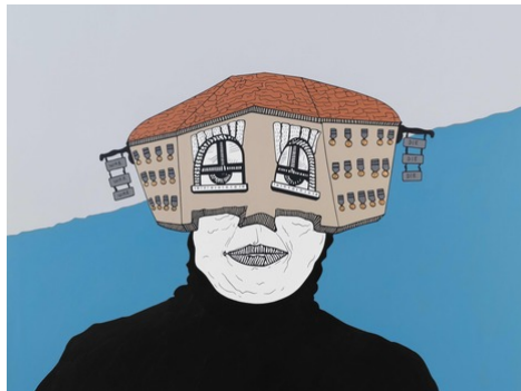
Seine Kunst vermittelt ein Gefühl von Unruhe und Instabilität: Kingslayer von Buğra Erol