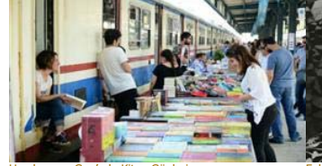
Haydarpaşa Garı'nda Kitap Günleri